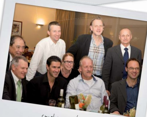
sprekers en bestuur.