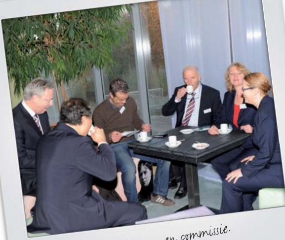
Tevreden bestuur en commissie.